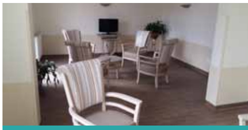
Salle de détente avec télévision

L'offre de service à la carte apporte une réponse personnalisée selon vos envies. Ainsi, en fonction de vos choix, vous disposez de services optionnels qui vous sont proposés en supplément de la formule de base.