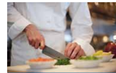
Des repas de qualité toute l'année confectionnés par notre chef !