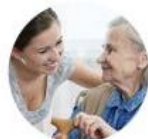
Seniors À Votre Service