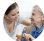
Un Air De Famille