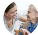
LA COMPAGNIE DES AIDANTS

Le service qui remportera le plus de votes de la part du public sera lauréat dans sa catégorie.